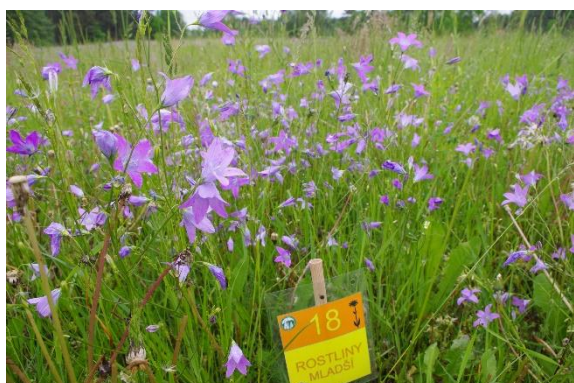
c/ zvonek rozkladitý