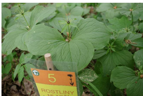
b/ vraní oko čtyřlíst