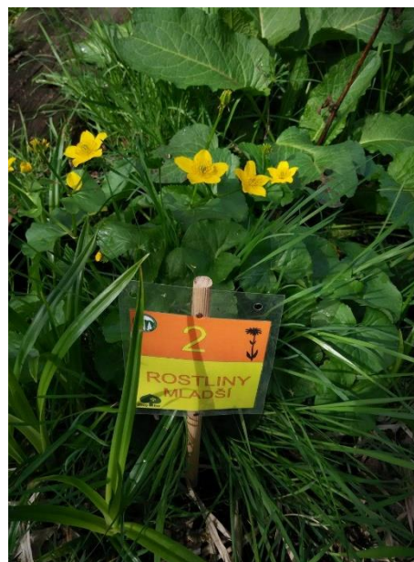
d/ blatouch bahenní