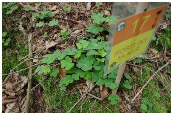
a/ šťavel kyselý