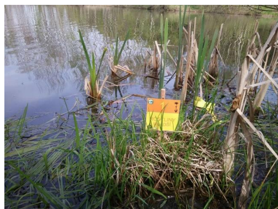
e/ orobinec širolistý