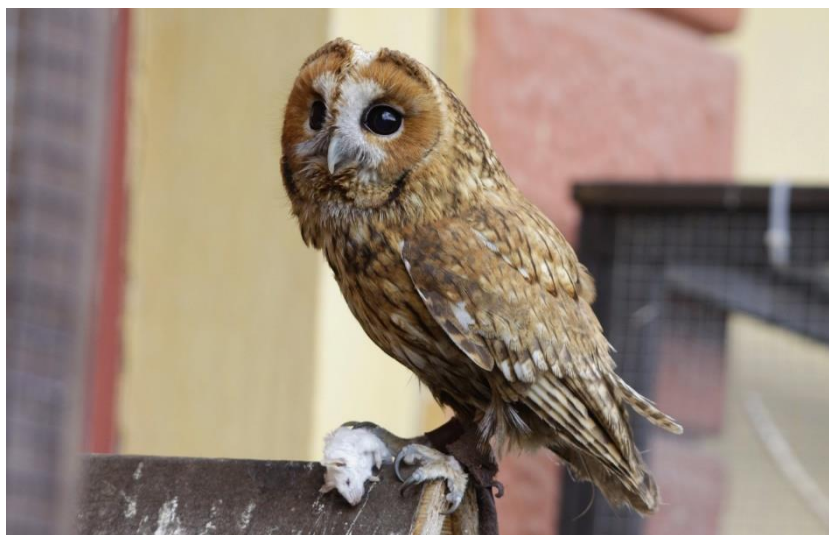
a) Puštík obecný / sova obecná

7) Určete do druhu (3 body: 0,5 bodu za každé jednotlivé správné určení)