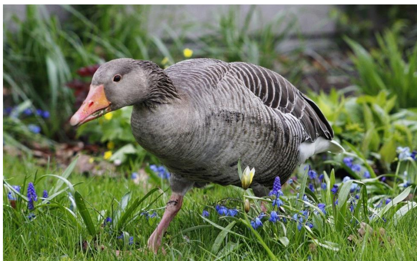
c) Husa velká / husa divoká / husa šedá