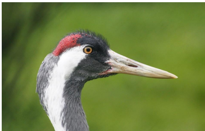
b) Jeřáb popelavý / jeřáb obecný / zorav obecný