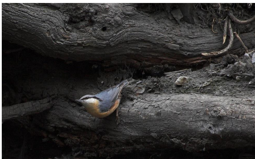
d) Brhlík lesní / brhlík obecný