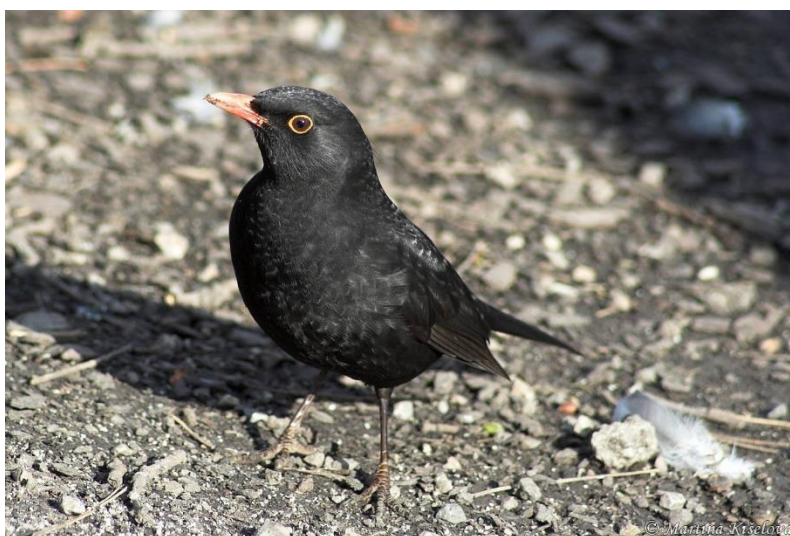
f) Kos černý / kos obecný