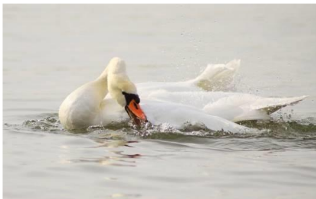
Labuť velká (krotká)