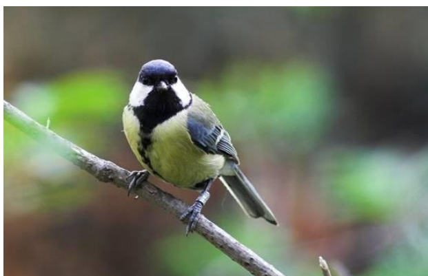
Sýkora koňadra (koňadra obecná)